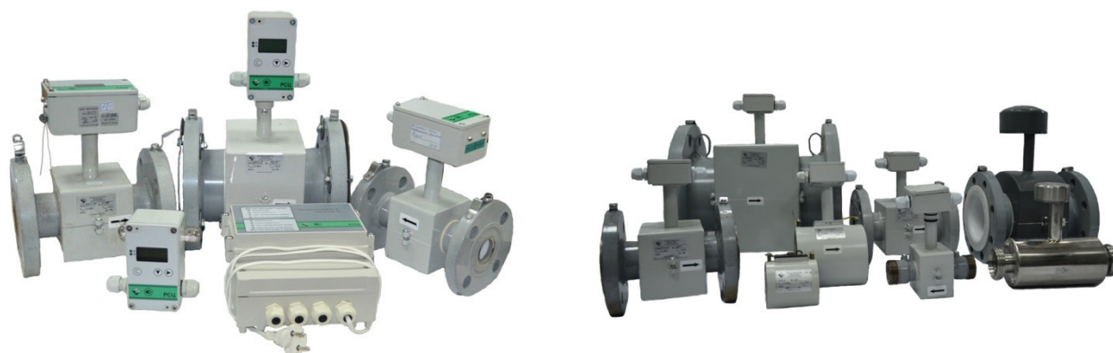
Рисунок 1 - Общий вид расходомеров-счетчиков электромагнитных РСЦ

Схема пломбировки от несанкционированного доступа измерительного блока расходомеров-счетчиков электромагнитных РСЦ (рис.2а) осуществляется нанесением знака поверки давлением на свинцовую (пластмассовую) пломбу, которая навешивается на проволоку (кордовую нить), проведенную в отверстия в специальных пломбировочных винтах. Схема пломбировки от несанкционированного доступа, обозначение места нанесения знака поверки электромагнитного преобразователя расхода расходомеров-счетчиков электромагнитных РСЦ осуществляется нанесением знака поверки давлением на свинцовую (пластмассовую) пломбу, которая навешивается на проволоку (кордовую нить) проведенную через специальные пломбировочные отверстия для квадратного типа клеммной коробки (рис.2б), и для круглого типа клеммной коробки (рис.2в) проволока проводится через отверстие в специальном пломбировочном винте. Места пломбирования расходомеров-счетчиков электромагнитных РСЦ приведены на рисунке 2.