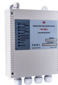
регистратор расхода отдельно-выносного исполнения ООО «ВТК Прибор»