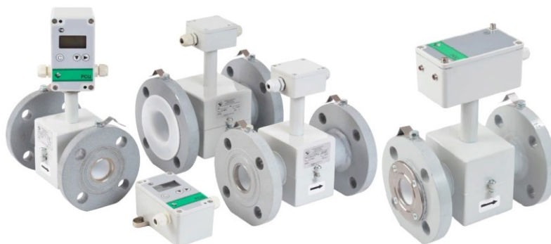
расходомеры-счетчики электромагнитные РСЦ

В качестве средств измерений объемного расхода жидкости и объема жидкости в потоке в составе теплосчетчика могут применяться: первичные преобразователи расхода в комплекте с регистратором расхода (производства ООО «ВТК Прибор» г. Киров) и/или расходомеры-счетчики электромагнитные РСЦ (регистрационный номер 71286-18). Общий вид средств измерений объемного расхода жидкости и объема жидкости в потоке в составе теплосчетчика представлены на рисунке 2.