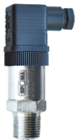
датчик избыточного давления с электрическим выходным сигналом ДДМ-03Т-ДИ