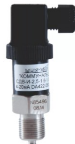
преобразователь давления измерительный СДВ