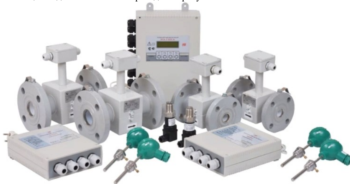
Рисунок 4 – Общий вид теплосчетчиков

Общий вид теплосчетчиков приведен на рисунке 4.