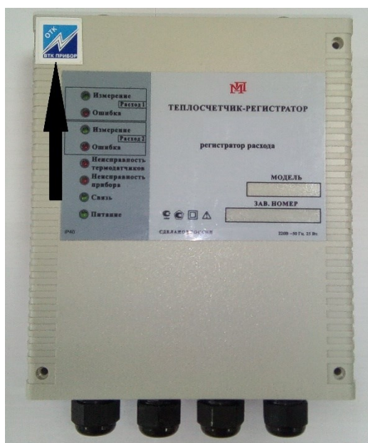
Рисунок 7 – Схема пломбировки от несанкционированного доступа, обозначение места нанесения знака поверки на корпус регистратора расхода раздельно-выносного исполнения