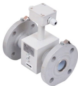
первичный преобразователь расхода ООО «ВТК Прибор»